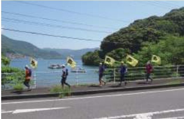
6月1日 R311絶景の中を走る