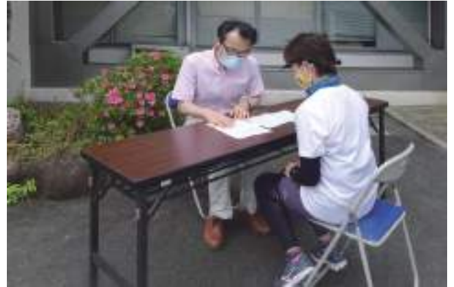
6月2日 大紀町役場ドクターチェック