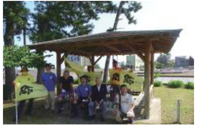
5月31日 花の窟にて記念撮影