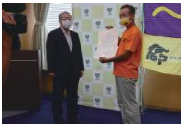
三重大学から生命の駅伝の会への感謝状