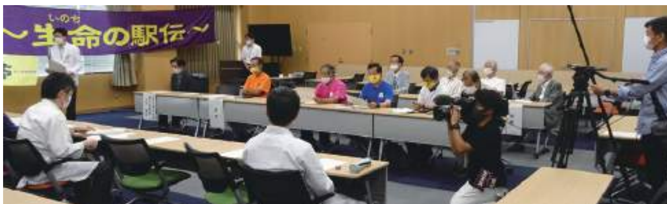
受賞者と生命の駅伝の会との交流