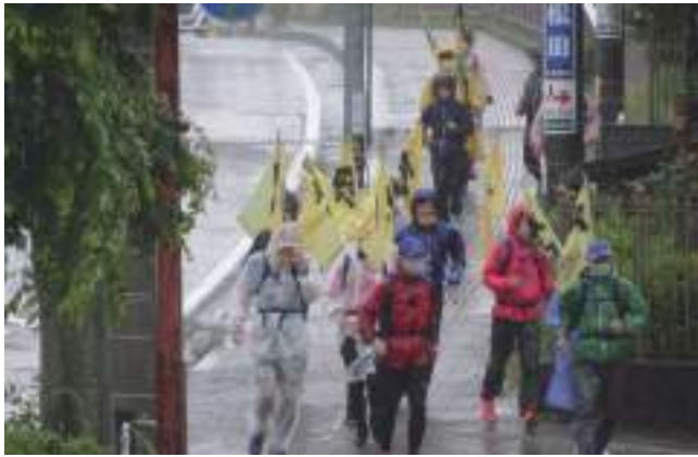
5月27日 激しい雨の中を果敢に走る