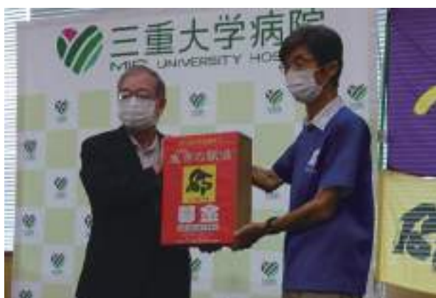
生命の駅伝の会から三重大学への寄付贈呈