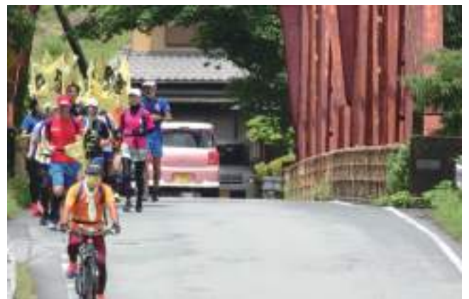
6月6日 会長が53kmを先導