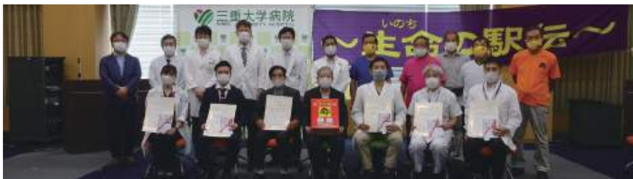
生命の駅伝がん研究奨励賞受賞者を囲んで