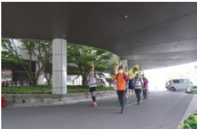
6月2日 松阪市民病院 竹上市長RUN