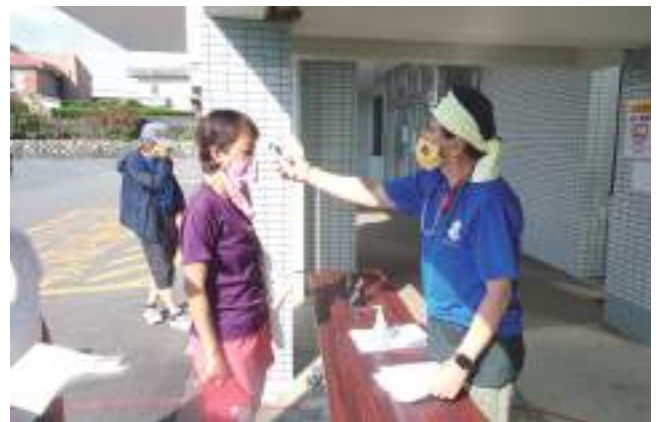
6月3日 志摩市民病院ドクターチェック