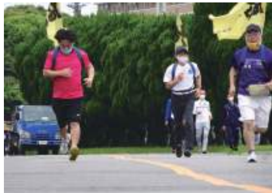
22日 三重大学 Opening Run & Walk